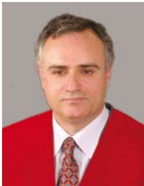
د. نجيب أبو كركي

الجامعة - قرر رئيس الجامعة الدكتور خالد الكركي تعيين الدكتور نجيب أبو كركي رئيساً للجنة