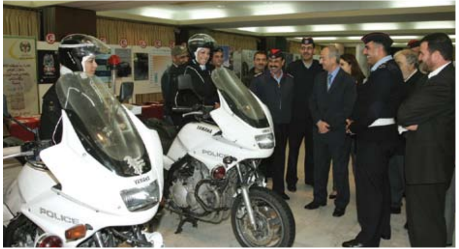
جند الأردن رجالاً ونساءً

الجامعة - افتتح في الجامعة في الثالث من تشرين الثاني الجاري «معرض التوعية المرورية» الذي نظّمته الجمعية الملكية للتوعية الصحية فرع كفى للتوعية المرورية ودائرة الهيئات الطلابية في عمادة شؤون الطلبة. وهدف المعرض الذي افتتحه نائب رئيس