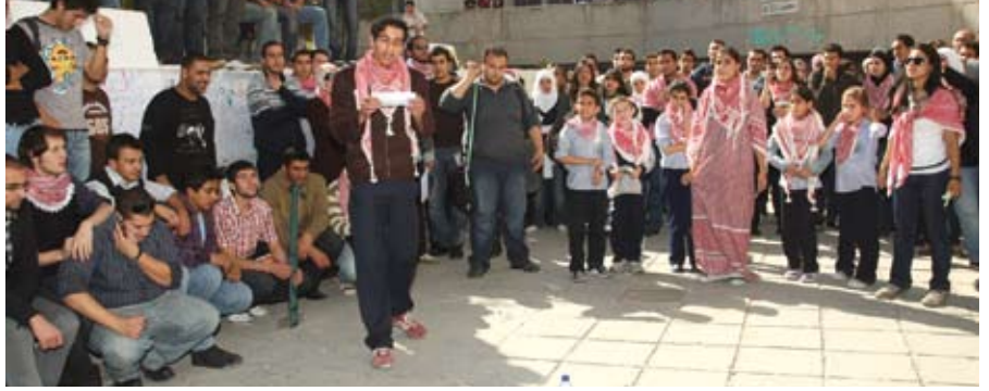
طلبة الجامعة يحيون ذكرى تفجيرات عمان