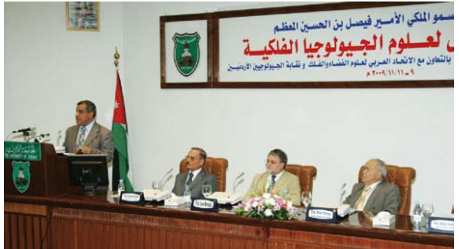
الجيولوجيون يدرسون المواقع الأثرية