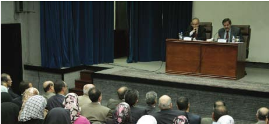
طلبات المنازل يشكرن الجامعة

الجامعة - سمحت الجامعة لطلبات المنازل الإقامة داخل الحرم الجامعي خلال فترة العطلة ما بين الفصلين، مع وعد بحل كافة العقبات التي تواجههن خلال «فترة قصيرة». وقرر رئيس الجامعة الدكتور خالد الكركي خلال لقائه مجموعة من طالبات المنازل السماح للطلبات اللاتي يفتدن من المحافظات البعيدة والطلبات العربيات والاجنبيات الإقامة خلال العطلة بعد ان كان ذلك غير متاح لبعضهن. وتركزت مطالب المشاركات في اللقاء على الطلب بالسماح لهن البقاء في المساكن خلال العطلة للتسهيل... تتمه ص ٥