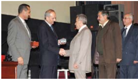
المكرمون وحفاوة بالغة