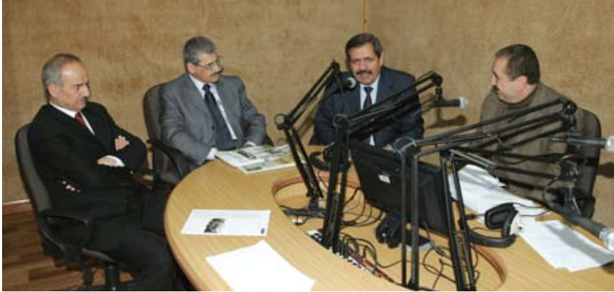
إذاعة الأردن... إبداع آخر لصالح الجامعة

الجامعة- انطلقت الدورة البرمجية لإذاعة الجامعة «صوت المستقبل» في التاسع من تشرين الثاني الجاري إيذاناً ببدء مرحلة جديدة لصوت أردني حافل بالعباء والانجاز.