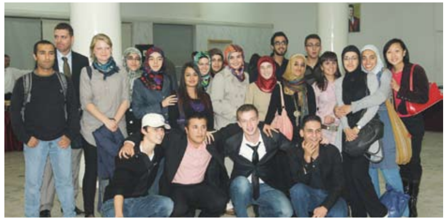
العربية محط أنظار الجميع

من جهتهم أعرب الطلبة الأجانب عن سعادتهم بالدراسة في الجامعة والإقامة في المملكة مشيدين بكرم الضيافة وحسن معاملتهم.