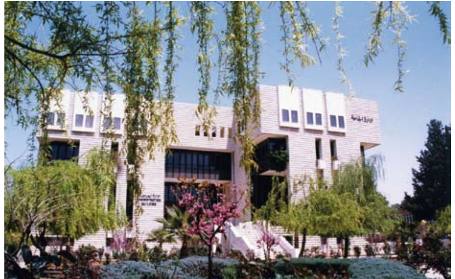
تعليمات جديدة لقبول طلبة البرامج الدولية

الجامعة - قرر مجلس عمداء الجامعة تعديل تعليمات قبول الطلبة في البرامج الدولية للدراسات العليا. وبحسب القرار فإنه يقبل في هذه البرامج الطلبة المتمتعون بالجنسية غير الأردنية والأردنيون المقيمون خارج المملكة على أن يحضروا ما يثبت إقامتهم خارج البلاد بالإضافة إلى الأردنيين الحاصلين على منح من جهات دولية. واشترط القرار على المشمولين بالقرار أن يكونوا حاصلين على الدرجات العلمية المؤهلة للالتحاق بهذه البرامج وأن تنطبق عليهم الشروط العامة للقبول في برامج الدراسات العليا وشروط القبول الخاصة بالبرنامج الذي يرغبون الالتحاق به.