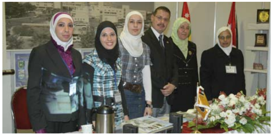
وجوه أردنية في معرض طبي عالمي

مقصداً على مستوى المنطقة في مختلف النواحي الطبية والعلاجية لما حققته المستشفيات الأردنية و دور الرعاية الصحية من سمعة وكفاءة عالية في مجالات الطب واختصاصاته على اختلافها وتنوعها.