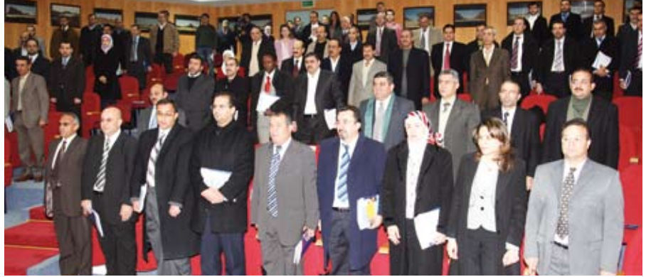
شراكة أردنية أوروبية مستمرة

والبحث العلمي الدكتور تركي عبيدات في كلمة ألقاها في افتتاح المؤتمر إلى اهتمام الحكومة بترجمة توجيهات جلالة الملك عبد الله الثاني لتطوير مستويات التعليم في المدارس والجامعات ومراكز البحث العلمي بهدف تأسيس نظام تعليمي صحي يساعد على النمو والازدهار للنشاط الاقتصادي لتحسين نوعية الحياة للأردنيين.