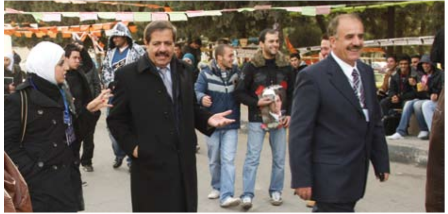
أجواء هادئة وروح ونابة