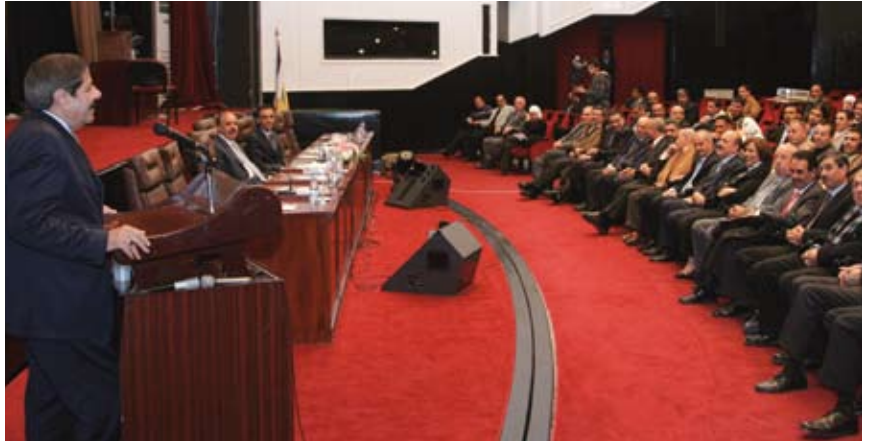
رئيس الجامعة متحدثاً لأعضاء المجلس الجديد

وحت أعضاء الاتحاد على العمل بروح الفريق الواحد للمحافظة على السمعة الطيبة للجامعة مشيراً إلى أن جامعات عالمية طلبت من «الأردنية» مساعدتها لافتتاح برامج دراسية لتعليم اللغة العربية فيها وفتح آفاق التعاون معها في الميادين العلمية والبحثية والثقافية.