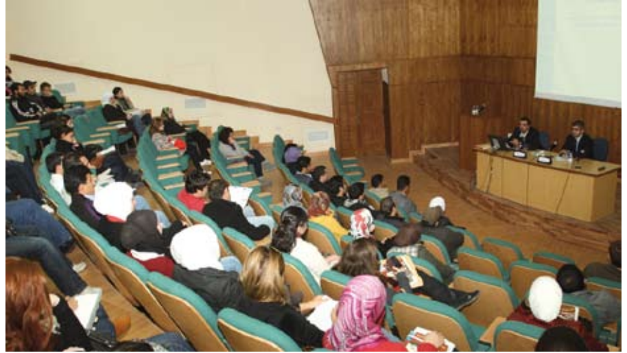
خبراء يتحدثون عن واقع السياحة الأردنية

وأشار إلى أن الهيئة عملت على تمثيل الأردن في المعارض السياحية العالمية كما تعمل على التصميم والاعداد والاشراف على إنتاج المواد الدعائية السياحية بالإضافة إلى التوثيق الإلكتروني.