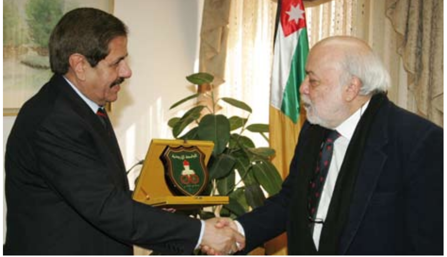
الاردنية تصمim على تعميم الفائدة

لغير الناطقين بغيرها. في المقابل، تدارس الطرفان امكانية انشاء كرسي (برنامج) للدراسات البوليفارية في الجامعة، يتوقع أن يتخذ من كلية الدراسات الدولية في الاردنية مكانا للمباشرة في عمله.