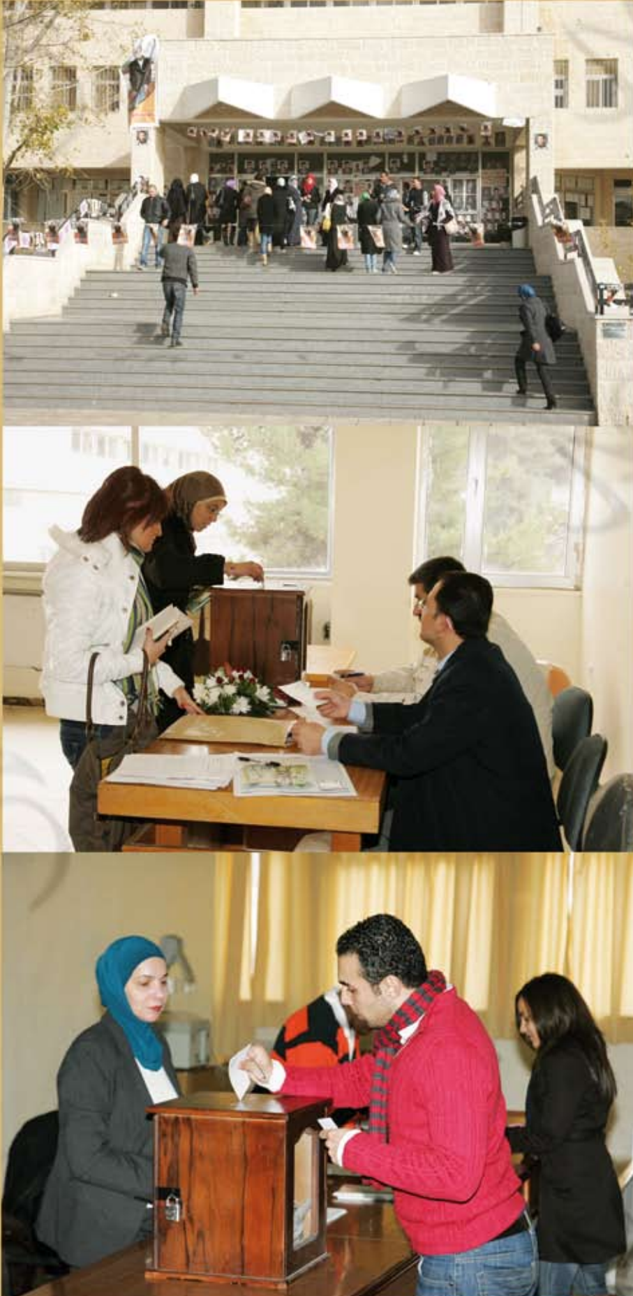
صور تعبر عن أجواء الانتخابات الراقية