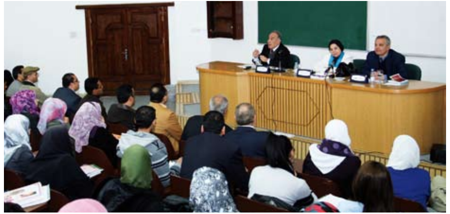
ندوة اللغة العربية

وتناول الدكتور الأسد مفهوم كلمة العولمة وهي كلمة عربية الصياغة معناها جعل الشيء عالمياً مشيراً إلى أن هذا الاصطلاح أول ما ظهر في الولايات المتحدة الأمريكية بعد أن أصبحت قوة اقتصادية وثقافية وعسكرية.