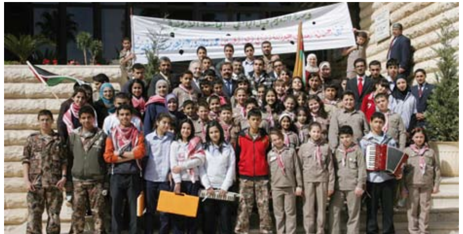
طلاب وطالبات المدرسة النموذجية يحيون المناسبة الغالية

وجابت شوارع الجامعة مسيرة كشفية وهي تحمل صور جلالته وإفادات تعبر عن حب طلبة المدرسة لجلالته.