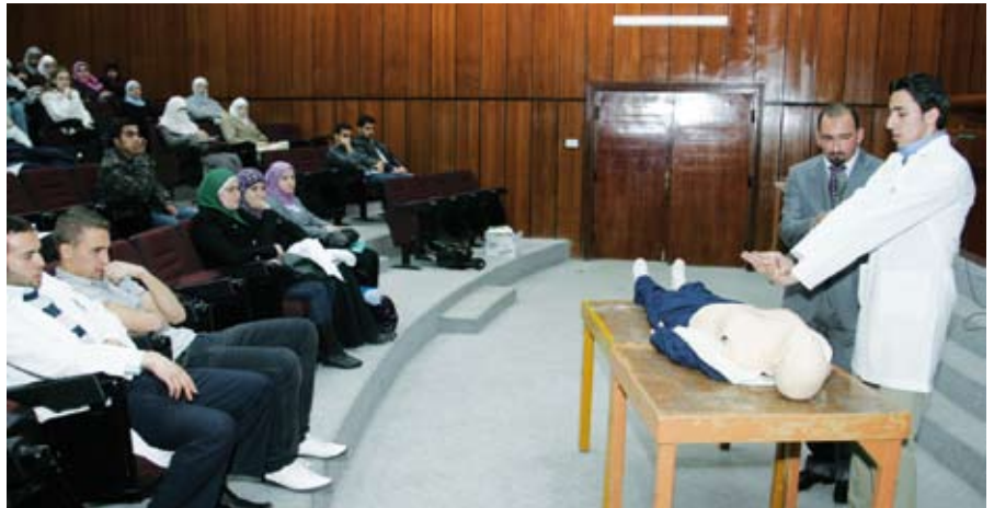
طالبة الجامعة يستجيبون لحملة الاسعافات الأولية

عمل محطات موزعة على أنحاء الجامعة لتقديمها للطلبة.