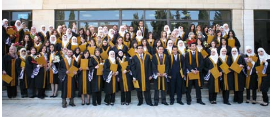
والجامعة تستقبل أفواجا وتودع اخريات

وسلم الدكتور مجدوبة الشهادات لخريجي الفصلين الماضيين الصيفي والأول البالغ عددهم (١١٠) وهنأهم بهذه المناسبة.