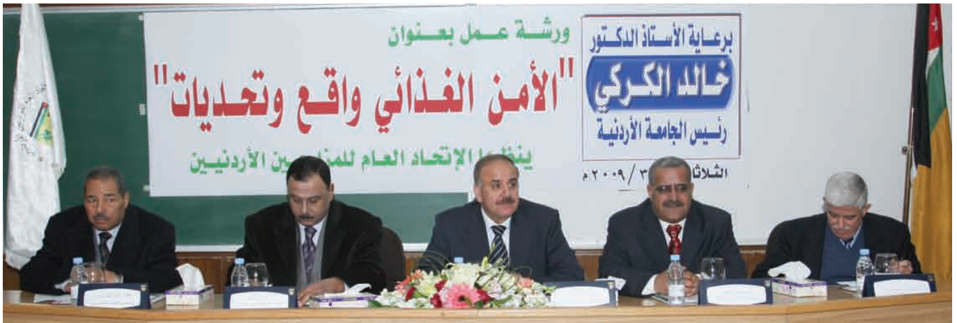
الجامعة تحتضن ورشة الأمن الغذائي

إلى التحديات التي تواجه الزراعة، داعين إلى ضرورة تكثيف إجراء البحوث والدراسات العلمية التي تمكن المؤسسات الزراعية والمزارعين من مواجهة الصعوبات التي تعترض الزراعة الأردنية.