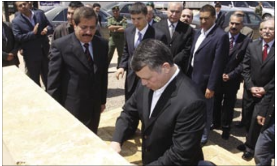
جلالته يضع حجر الأساس للجامعة الأردنية في العقبة