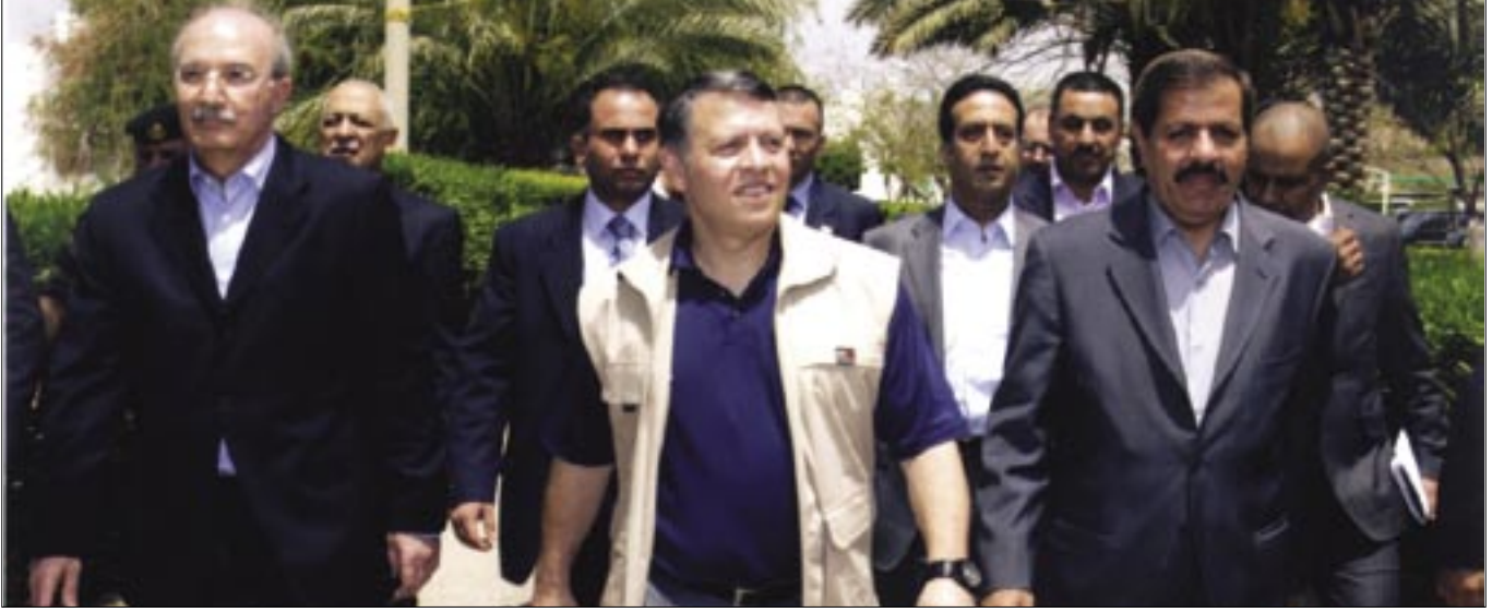
جلالته يفتتح معهد البحوث والتدريب والإرشاد والتعليم الزراعي

والتعليم العالي واحد من أبرز الحقول التي حظيت ومازالت تحظى باهتمام ملكي مباشر، كون الجامعات تعد اللبنة الأولى في تكوين جيل ذو طاقات ابداعية قادرة على العمل والإنجاز الذي لا يقتصر على طلبة الجامعة فقط بل يمتد إلى المجتمع المحلي، فجاء الدعم الملكي عبر التحفيز دوماً على التطوير للارتقاء بمخرجاتها.