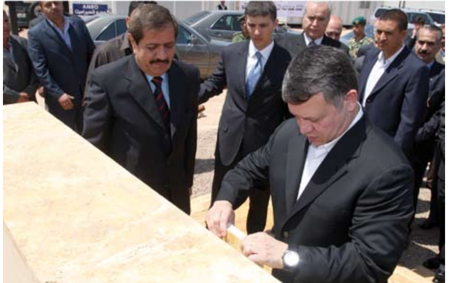
جلالة الملك يضع حجر الأساس لكليات العقبة

الجامعة- عندما تتحدث الحجارة الجدران وصفحات الكتب فتلك شهادتها والصخور والأطرافيف، فتلك اكبر شاهد على العصر بان ام الجامعات «الاردنية» على عظمة الزمان والمكان. وعندما تنطق دالة التاريخ الاردني على الشهادة... تتمه ص ٤