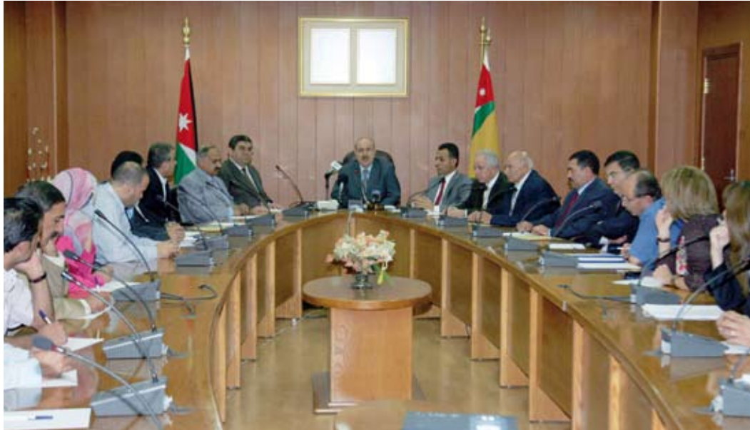
لجنة تنسيق القبول تعلن قوائم الطلبة المقبولين

في مختلف الجامعات الرسمية. وأوضح ان بإمكان الطلبة الراغبين الاستفسار عن القبول والاجراءات المتعلقة بتسجيلهم يمكنهم الاتصال على هاتف اللجنة ٥٣٠٠٥٠٠ من الساعة الثالثة بعد الظهر وحتى الساعة السادسة.