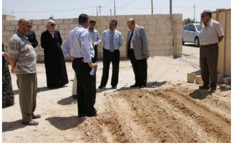
الجامعة وتمكين المرأة في الزراعة