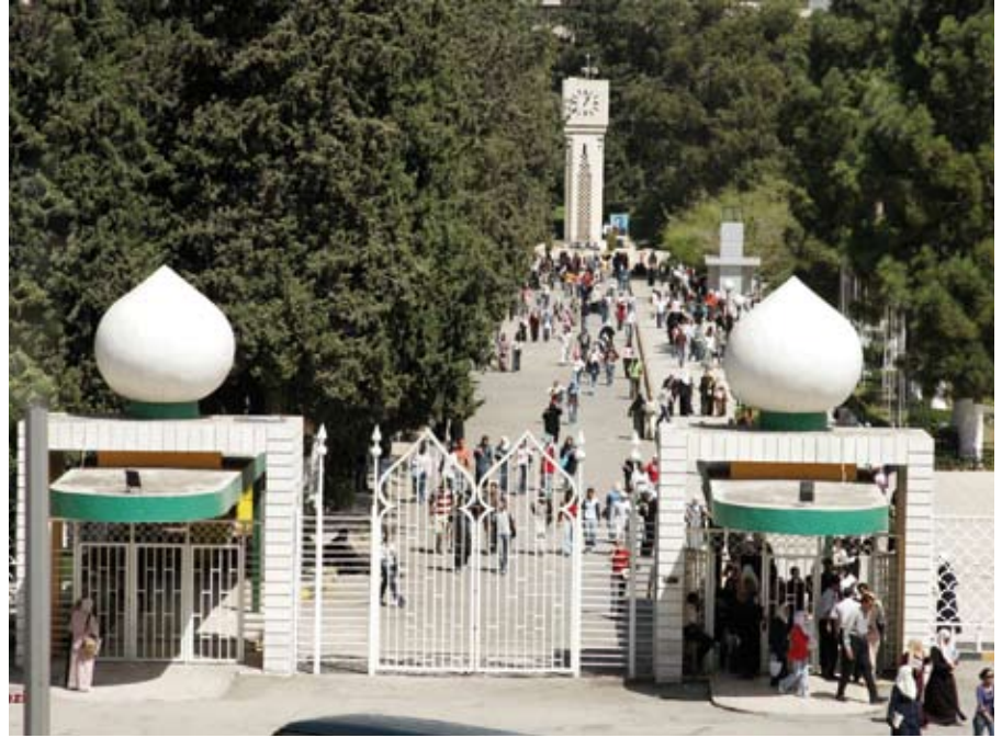
الجامعة الأردنية مؤتل الصالحين والجادين

كما يهدف المركز الى المساهمة في حصول الجامعة على شهادات الاعتماد وضمان الجودة المحلية والعالمية التي تخدم رسالتها وتحقق أهدافها.