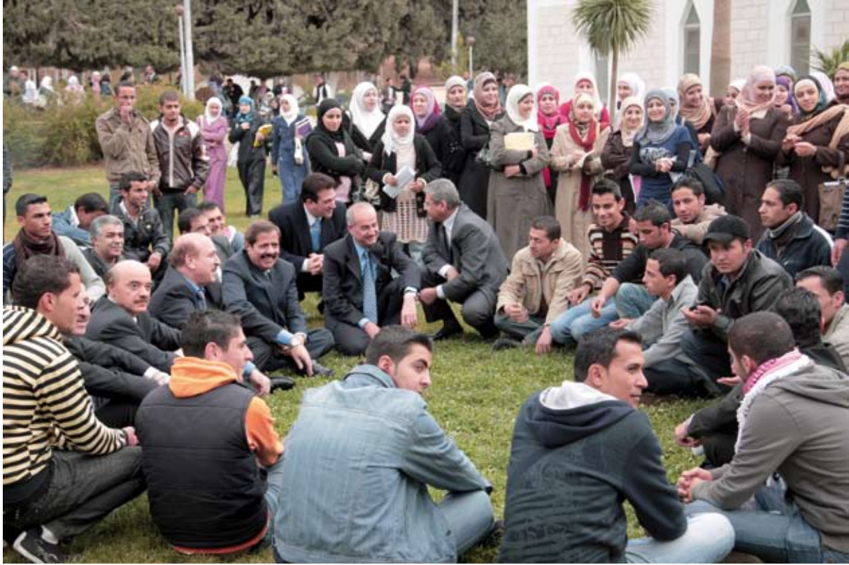
رئيس الجامعة وجلسة أسرية مع الطلبة

لدراسات القدس هو الاول على مستوى المنطقة لتواصل حديث الاصاله والتاريخ الحر والكلمه الوطنيه الشريفه التي تخرج من رحم صرح علمي لا اهداف له او مآرب سوى الحفاظ على بوتقة علمية رائدة اريد لها ان تحمل اسم الاردن. واليوم والجامعة الام تحتضن ذلك الكم من الطلبة والتخصصات وتبدع وهي تؤسس لفرع في العقبة يحمل رسالتها بتخصصات عصريه تتناسب وواقع الحياة ومتطلبات السوق تفتح الجامعة بوابة التاريخ بسرعة لتعرض قصتها التي بدأت عام ١٩٦٢، حيث بدأت ب ١٦٧ طالبا وطالبة وكلية وهيئة تدريسية واحدة، وميزانية قدرها ٥٠٦٩٧ ديناراً وبحرم جامعي ضم مبنين صغيرين فقط. وكبرت القصة لتضم الان حوالي ٣٨ ألف طالب وطالبة، وعشرين كلية تتوزع بين العلوم الإنسانية والعلوم التطبيقية والطبية، أحدثها كلية للدراسات العليا للتنسيق والإشراف على برامج الماجستير والدكتوراه.