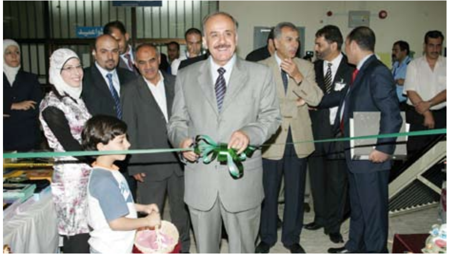
الدكتور القضاة مفتتحاً البازار

القضاة الذي افتتح البازار على معروضاته من مواد غذائية وتموينية و منسوجات وأشغال يدوية ومستلزمات الأسرة من أجهزة كهربائية و منزلية. ولفت الدكتور القضاة إلى أهمية فكرة البازار الذي يدعم التعاون بين المستشفى و قطاعات المجتمع المحلي ومؤسساته وجمعياته المختلفة للتسهيل على العاملين والمرضى والزوار والمراجعين وتلبية احتياجاتهم الرمضانية خلال الشهر الفضيل. وبين أن البازار يدعم فئات وشرائح مختلفة في المجتمع منها نوا الاحتياجات الخاصة والنساء العاملات في المشاريع المنزلية والمشاريع المهنية واليدوية الإنتاجية. وحضر افتتاح البازار عميد كلية الطب في الجامعة وحشد من المسؤولين في المستشفى والمرضى والمراجعين. وفي هذا الصدد، عادت الأسرة الإدارية في المستشفى المرضى الذين يرقدون على أسرة الشفاء وهنأت المرضى بمناسبة حلول شهر رمضان الفضيل وقدمت لهم باقات زهور. وثنى المرضى هذه المبادرة التي تجسد العلاقة الطيبة بينهم والعاملين في المستشفى.