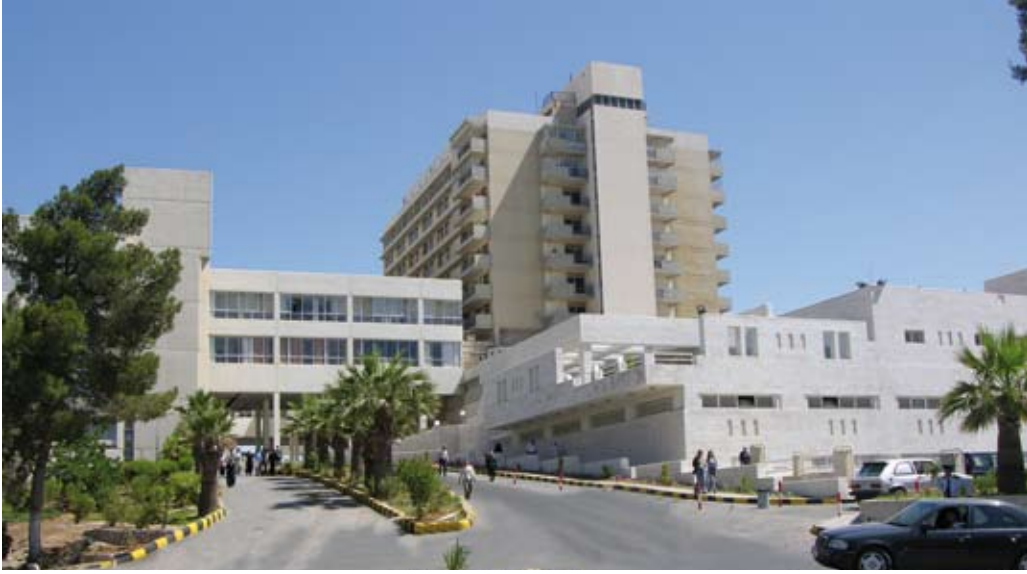
مستشفى الجامعة ... صرح طبي عريق

والرعاية التمريضية والأطباء والصيادلة، والوقت المستغرق في معاملات المختبر، ومستوى نظافة المستشفى والخدمات المقدمة لذوي الاحتياجات الخاصة والإعاقات الحركية ومستوى رضا أهل وعائلات المرضى والمراجعين.