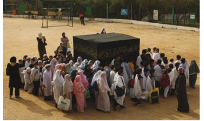
الحج أشهر معلومات

الجامعة- نفذت مجموعة من طلبة المدرسة النموذجية في الجامعة الذي يتزامن مع «يوم التروية» تطبيقات عملية لمناسك وشعائر الحج المقدس . ويعكس هذا النشاط العلمي الإيماني اهتمام إدارة المدرسة البالغ بغرس القيم الإيمانية في نفوس الطلبة وتعريفهم بمراحل هذه الشعيرة الخالدة علميا وعمليا ومعرفيا . وتضمن النشاط قيام الطلبة بتطبيق عملي للإحرام من الميقات والطواف بالكعبة المشرفة والسعي بين الصفا والمروة والوقوف بعرفات ورمي الجمرات وذبح الهدي والتحلل من الإحرام . وعبر الطلبة المشاركون عن سعادتهم بإقامة هذه النشاطات التي تعمل على تكامل وبناء شخصية الطالب المدرسي من جميع جوانبها العلمية والبحثية والتدريبية.