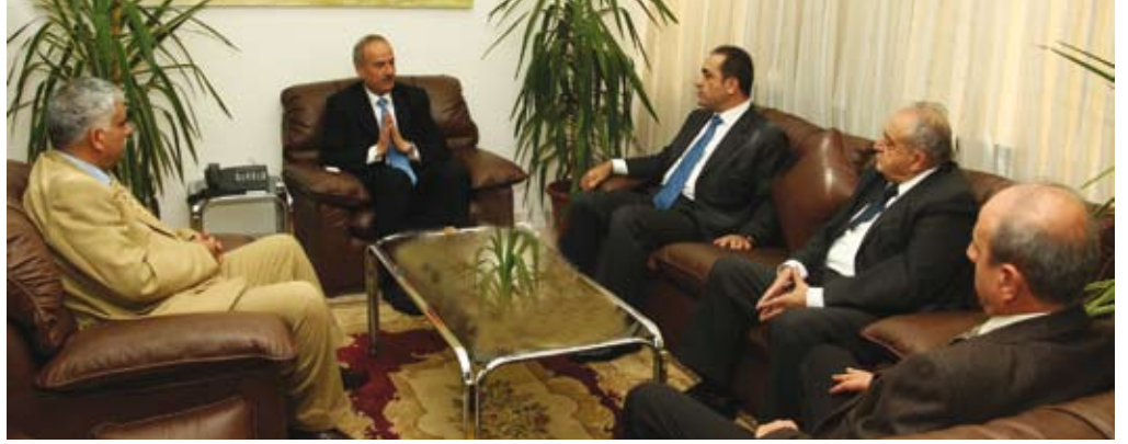
شراكة مستدامة بين غرفة التجارة والجامعة