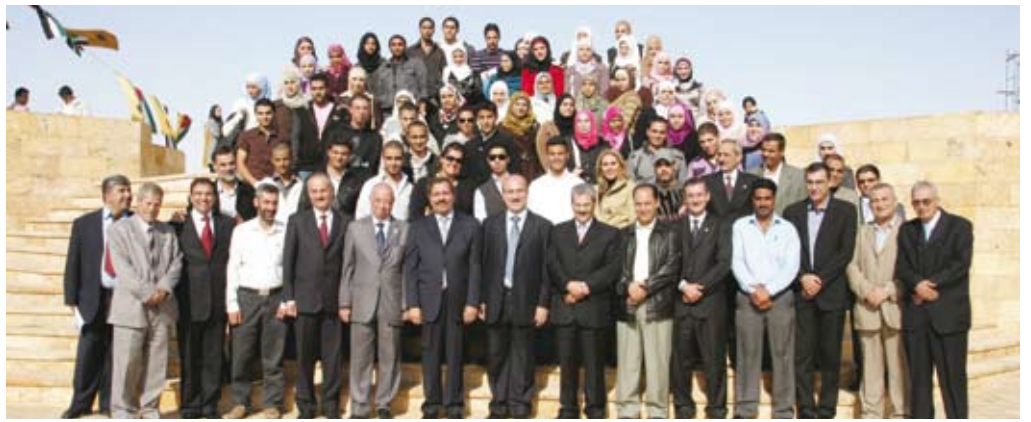
وتمتد الأردنية جنوباً علماء وعلماء

واستعرض إنجازات المشروع ومنها المبنى الاول الذي يضم سبع قاعات تدريسية تتسع الواحدة منها لستين طالباً وطالبة وانجاز مختبر حاسوب ومكتبة تضم مؤلفات وكتباً ومراجع يحتاجها طلبة الجامعة وصلات للكفيري ومكاتب لاعضاء هيئة التدريس والاداريين في الجامعة.