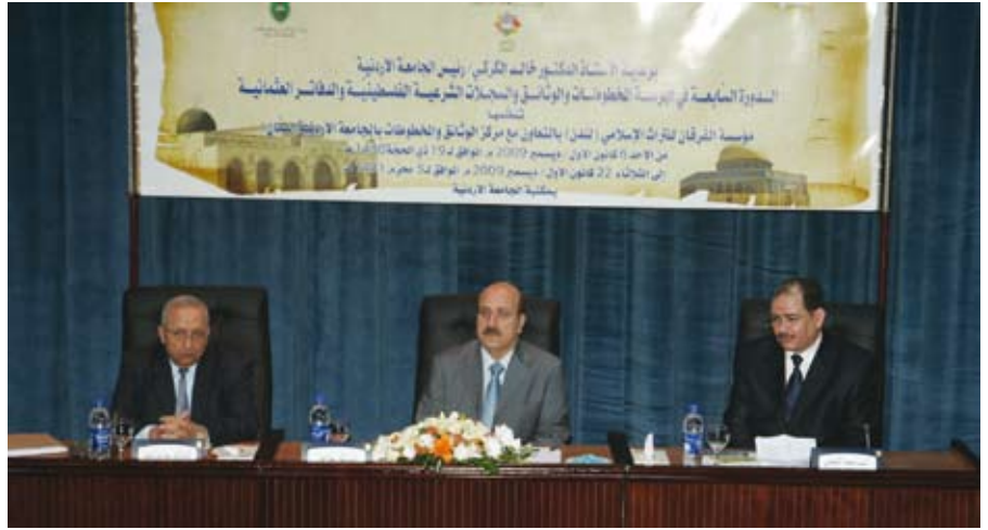
فلسطين من الأردنية وقفة معروفة

ويشارك في أعمال الدورة عدد من أمناء المكتبات في الجامعات والمؤسسات التوثيقية في فلسطين والعراق والأردن.