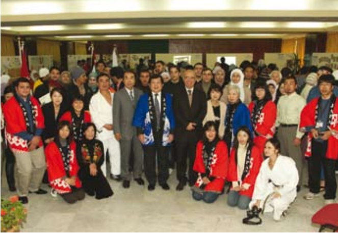
تعاون أردني ياباني متواصل

وأعربت السفارة في بيان لها عن تقديرها للجامعة على استضافة هذا المهرجان الذي يهدف إلى تقديم جوانب متعددة من الثقافة اليابانية للجمهور الأردني خصوصاً طلبة الجامعة. حضر فعاليات المهرجان عدد من أعضاء هيئة التدريس وجمع من طلبة الجامعة وعدد من أبناء الجالية اليابانية في عمان.