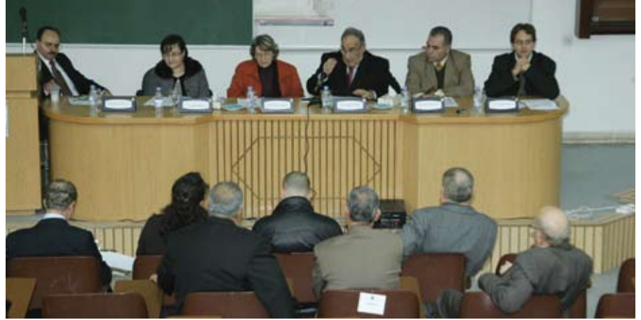
ورشة عمل تلامس احتياجات الوطن

وسوريا ولبنان وهي تجمعات بنيت دون شمولها بمخططات تنظيمية مثل مراكز المدن والمناطق المجاورة لها وتشمل أيضاً مخيمات اللاجئين.