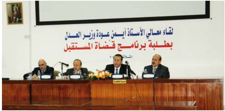
طلبة الجامعة والقضاء

بالكفاءة والخبرة القانونية والمهنية. وأكد اهتمام الحكومة بإيفاد القضاة المتميزين إلى جامعات عريقة في بريطانيا وفرنسا لإكمال دراساتهم العليا بغرض التعرف على الثقافة القانونية في بلدان مختلفة.