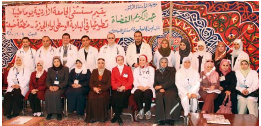
يوم طبي تطوعي في البادية الوسطى

الصحية والتوعوية والاجتماعية لمناطق جيوب الفقر وتحسين نوعية الخدمات الصحية المقدمة للمواطنين من خلال مساعدتهم بما تمتلكه مؤسسات الوطن ومستشفياته من معطيات وكفاءات توظف لمعالجة التحديات التي تواجه المواطنين خاصة تلك المتصلة بقطاعي الصحة والتعليم في تلك المناطق.