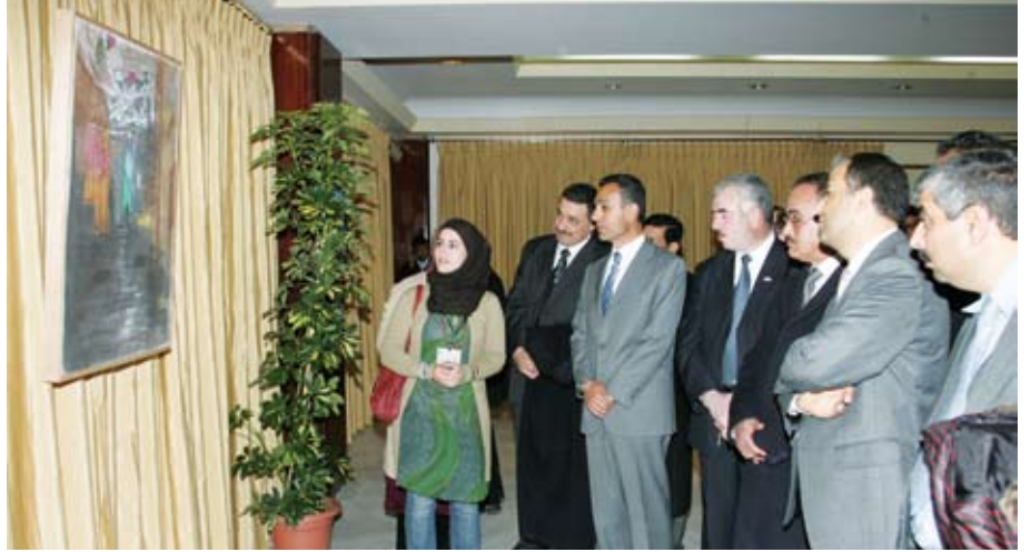
عيون الجميع تنو إلى القدس

شعرية ركزت على أهمية القدس الشريف كظاهرة حضارية تنفرد دون سواها من مدن العالم. وعرضت في الحفل الفني مسرحية معبرة وقدمت أغنية بعنوان «زهرة المدائن» فيما قدمت فرقة وكورال جامعة اليرموك أغنيات وطنية بهذه المناسبة. وعلى هامش الاحتفال كرم الدكتور صلاح أعضاء اللجنة الإدارية المنتهية أعمالهم في الاتحاد وشكرهم على جهودهم المخلصة من أجل رفعة الاتحاد وازدهاره.