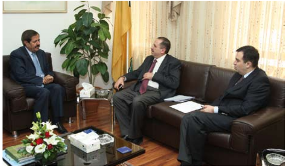
الدكتور الكركي ملتقىاً بالبشير وفاخوري

الجامعة - أعلن رئيس الجامعة الدكتور خالد الكركي انه بناء على التوجيهات الملكية السامية فإنه سوف يتم إنشاء مركز تدريب الطاقة النووية في حرم الجامعة في العقبة لخدمة الأردن والمنطقة العربية، وذلك بالتعاون مع هيئة الطاقة النووية الأردنية . وسيعمل المركز على تدريب الكوادر البشرية وتأهيلهم كخبراء واختصاصيين في قطاع الطاقة النووية التي تستخدم للأغراض السلمية سيما وان لدى دول المنطقة ومن بينها الأردن اهتمامات نحو استغلال الطاقة النووية في مشروعات تنموية مختلفة . ...تتمه ص ٧