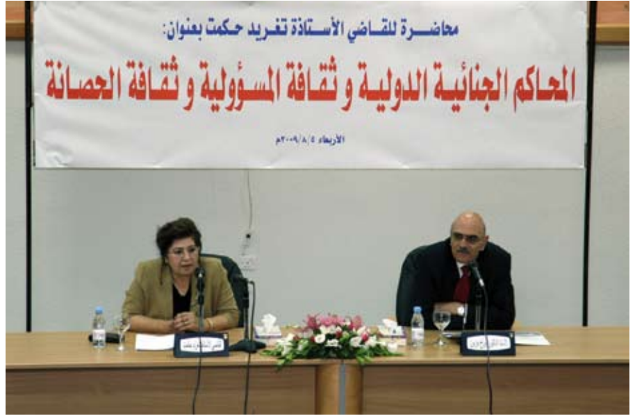
حكمت تتحدث عن المحاكم الجنائية الدولية

و تحدثت عن تجربتها في مهنة المحاماة ووصولها إلى السلك القضائي كأول امرأة أردنية تتولى منصب قاض و ذلك بعد المؤتمر العالمي للمرأة الذي عقد في العاصمة الصينية بكين عام ١٩٩٥ .