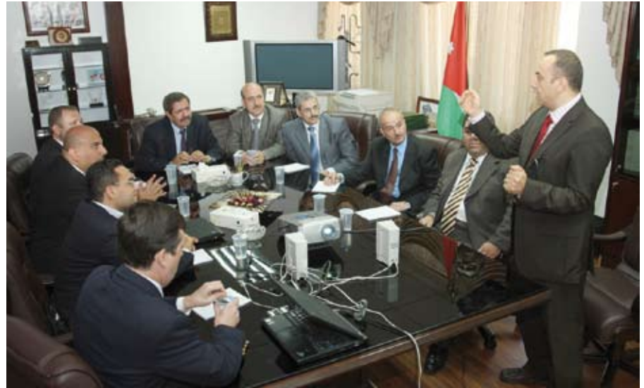
مندوب شركة سيسكو يقدم شرحاً حول شبكة الحاسوب الجديدة

وأشار الدكتور الكركي إلى تطلعات الجامعة لتوفير بيئة تعليمية تكنولوجية متقدمة تضاهي الجامعات العالمية بهدف إطلاق الطاقات الإبداعية لدى طلبة الجامعة وربط مخرجات التعليم باحتياجات سوق العمل على المستويين الوطني والإقليمي.