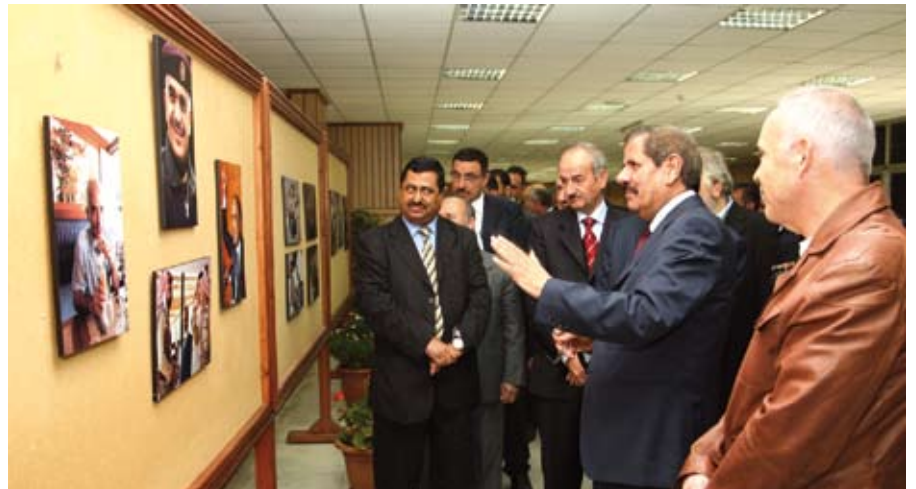
رئيس الجامعة يطلع على صور المغفور له الملك الحسين

الجامعة- استذكرت الجامعة في السادس من تشرين الثاني بكل معاني الإجلال ميلاد المغفور له جلالة الملك الحسين بن طلال طيب الله ثراه حيث أقيم بهذه المناسبة معرض وثائقي لصور جلالتة التقطتها عدسة المصور الفوتوغرافي الخاص بجلالته «زهرا ب أودنيس». وجال رئيس الجامعة الدكتور خالد الكركي على صور المعرض الذي جسّد حقبة تاريخية مهمة على... تتمه ص ٥