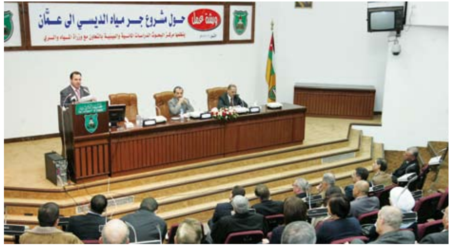
الديسي مشروع حيوي لنا جميعاً

وأضاف أن الأرقام تشير إلى أن متوسط نصيب الفرد للاستهلاك المنزلي في الأردن لا تتعدى (٧٥) م ٣ سنوياً وتصل في بعض مناطق المملكة إلى (٤٠) م ٣ سنوياً.