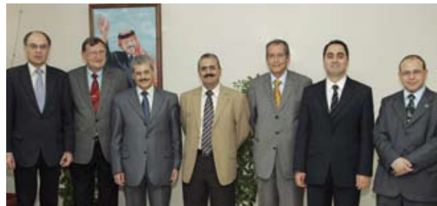
شراكة تعليمية أردنية تشيكية