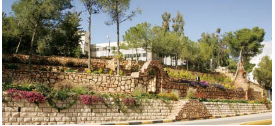
بيئة جامعية مريحة