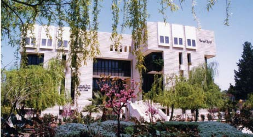
الجامعة واحة العلم والعلماء