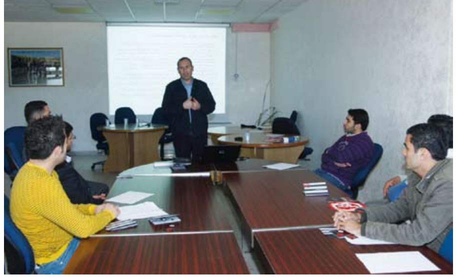
السلامة المرورية تستهدف الطلبة