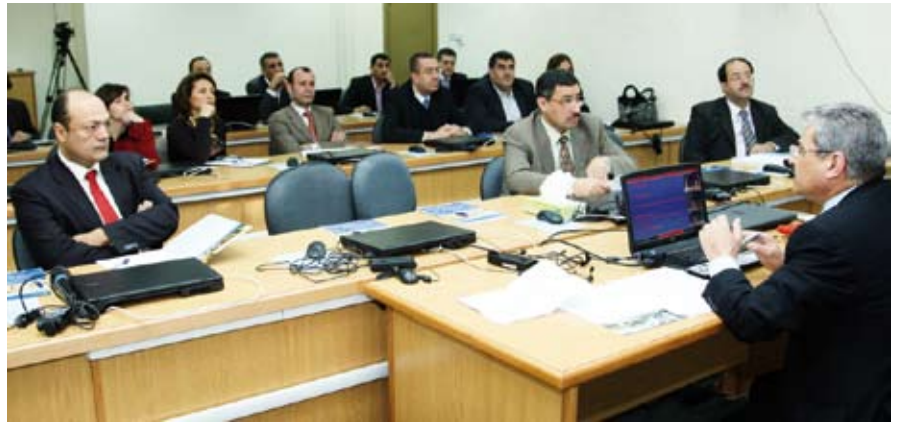
مركز جديد تطلقه الأردننية