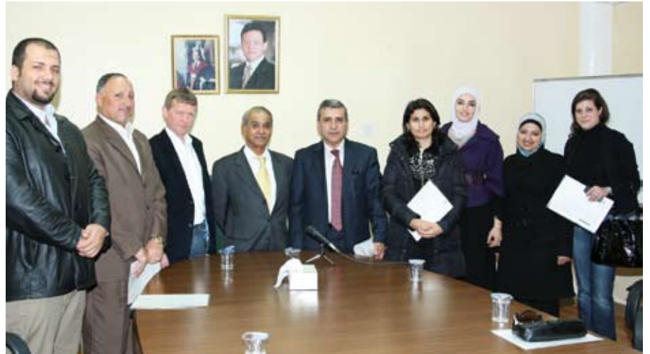
شراكة وانفتاح على الجميع

بدوره أكد البروفيسور سيبيرغ على أهمية استمرار البرنامج مشيراً الى ان الحكومة الدنماركية وافقت على تمديده لمدة عامين آخرين.