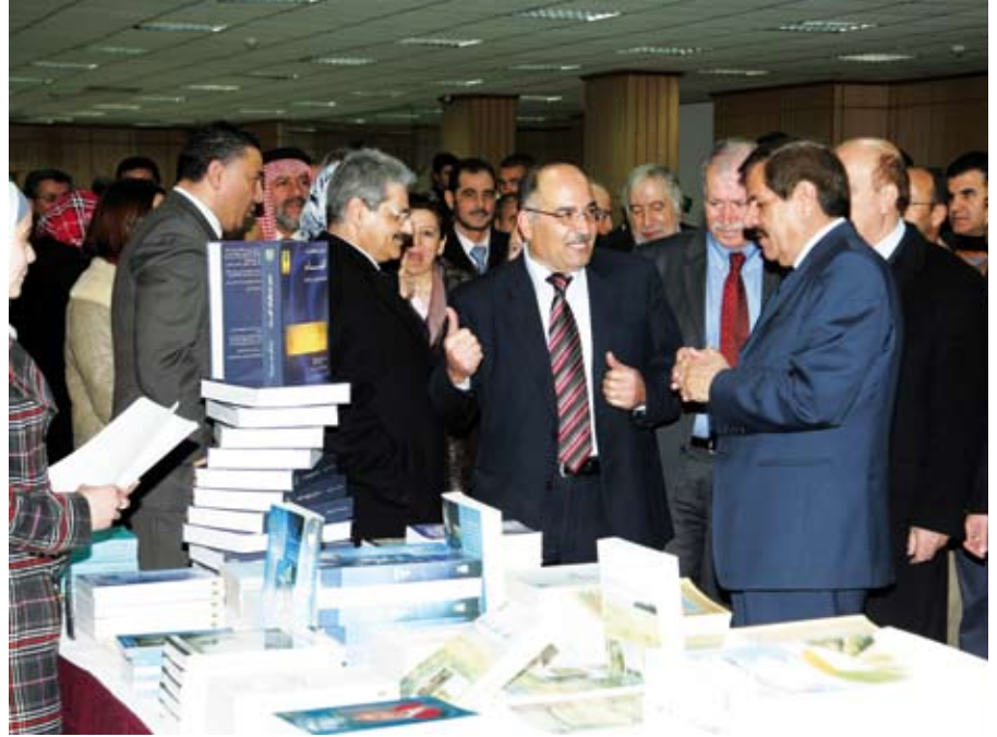
دعوة لدعم المكتبات العامة

وزار المعرض الذي أقيم في بهو مكتبة الجامعة أعداد كبيرة من طلبة الجامعة وأعضاء هيئة التدريس والمهتمين بالشؤون الثقافية والفكرية من داخل الجامعة وخارجها.