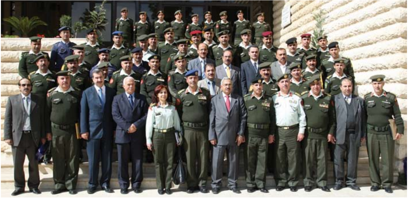
عسكريون ومدنيون في خدمة المجتمع

وفي ختام الاحتفال سلم مندوب القيادة العامة مدير العقيدة والتدريب المشترك الشهادات والجوائز التقديرية على مستحقيها مثلما تم تكريم عدد من اعضاء الهيئة التدريسية في الجامعة. وحضر الاحتفال عدد من مديري القيادة العامة وعدد من اعضاء هيئة التدريس في الجامعة.