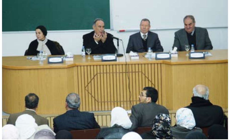
خطاب الآداب بين الأساتذة والطلبة